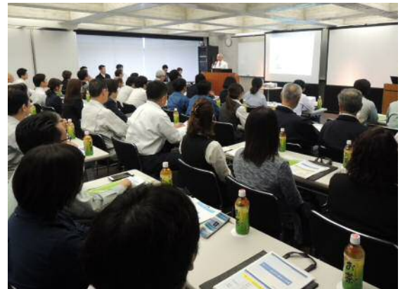
満席のため、会場が狭くなり申し訳ございませんでした

「セキュリティ対策は必要ですが、最後は結局『人間』であり、全員のセキュリティ意識を高めることが必要です。被害にあったときのリカバリーも含め、対策を講じていかなければいけません。」とまとめられました。